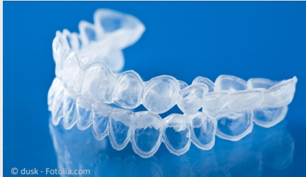
Bleaching-Form aus Kunststoff, in die Sie das Aufhellungs-Gel einfüllen.

Beim Home-Bleaching werden vom Zahnarzt dünne flexible Formen aus einem transparenten Kunststoff hergestellt, die genau auf Ihre Zähne passen (siehe Foto).