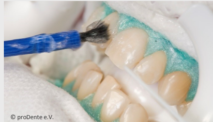
Power-Bleaching beim Zahnarzt: Auftragen des Bleaching-Gels

Wenn Sie die Praxis wieder verlassen, können Sie sich an sichtbar helleren Zähnen freuen!