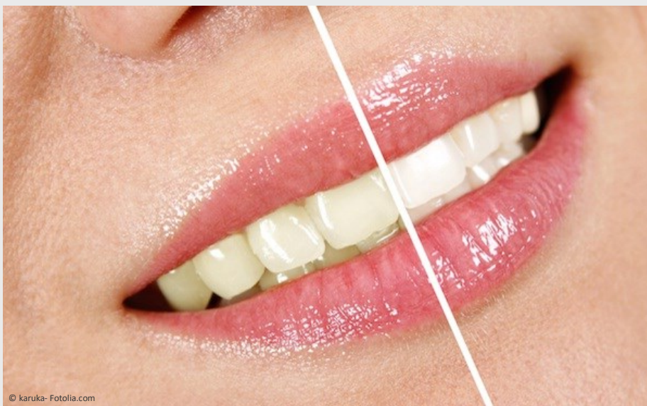
Deutlicher Unterschied: Professionelles Bleaching beim Zahnarzt wirkt!

Vertrauen Sie Ihre Zähne besser Profis an!