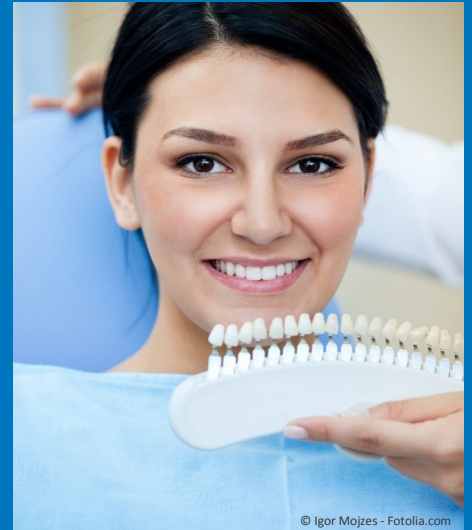
Bleaching vom Zahnarzt: Gewinnendes Lächeln mit strahlend weißen Zähnen

Dunkle Zähne können ein ziemliches Ärgernis sein: Obwohl sie sauber geputzt sind, wirken sie einfach nicht hell. Die Folge ist: Man traut sich oft nicht mehr, unbefangen zu reden und zu lächeln. Man achtet darauf, dass andere die Zähne nicht sehen. Und wenn man fotografiert wird, lässt man den Mund lieber zu. Das muss nicht sein: Zähne können heute mit bewährten Methoden wieder aufgehellt werden. Professionelles Bleaching beim Zahnarzt kostet nur wenige Hundert Euro. Aber das neue Lebensgefühl ist unbezahlbar!